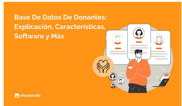
Una Guía Sobre La Base De Datos De Donantes Para Organizaciones Sin Fines De Lucro