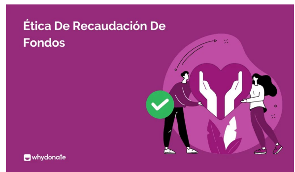
¿Qué Es La Política Ética De Recaudación De Fondos? Significado, Importancia Y Más