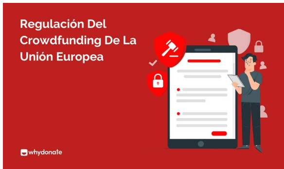
Lo Que Necesitas Saber Sobre La Regulación Del Crowdfunding De La Unión Europea