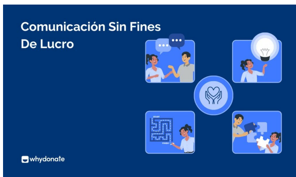
Qué Es La Comunicación Sin Fines De Lucro: 8 Formas De Mejorar Tu Estrategia De Comunicación Sin Fines De Lucro